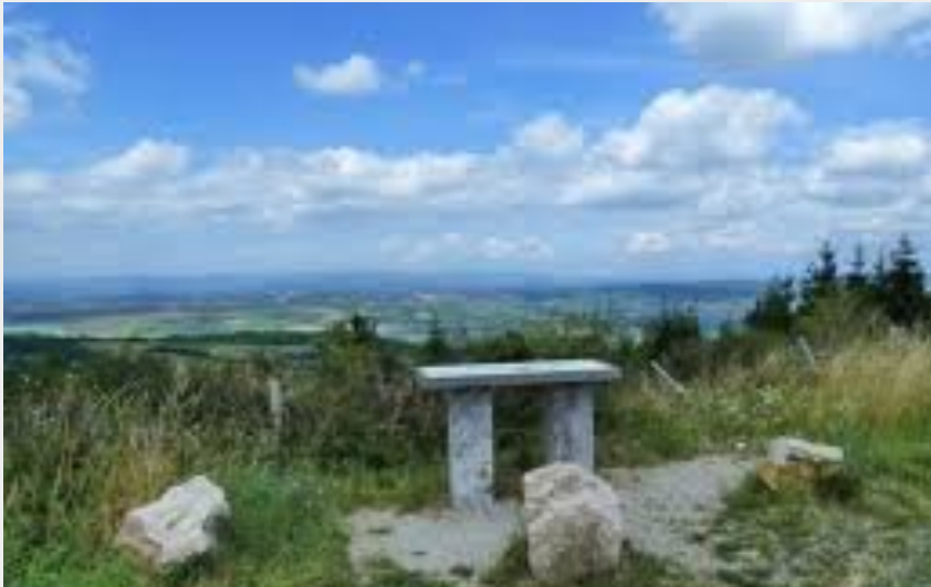
Crédit photo : Table d'orientation de Beauregard (OFFICE DE TOURISME DE PARELOUP LEVEZOU)