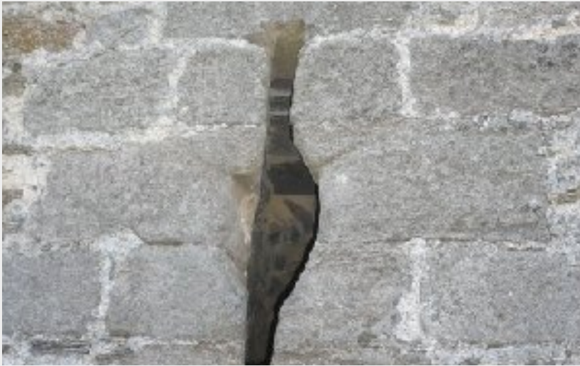
Tour templière de La Clau