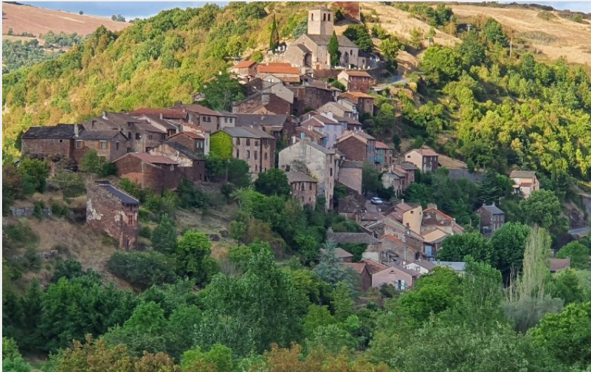
Crédit photo : Vue du village de Combret "Petite Cité de caractère" (© Jean-Philippe Sabathier)