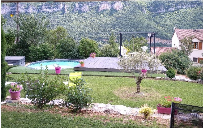
Crédit photo : Le Loft Cocoon gorge du tan gîte de prestation (Le Loft Cocoon)