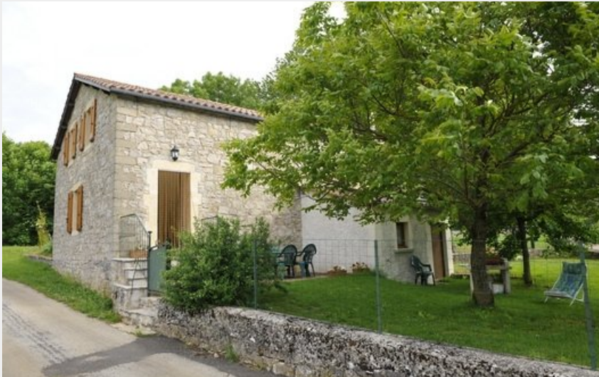
Crédit photo : Gîte de France "Le Noyer" (Informations Viala du Pas de Jaux)