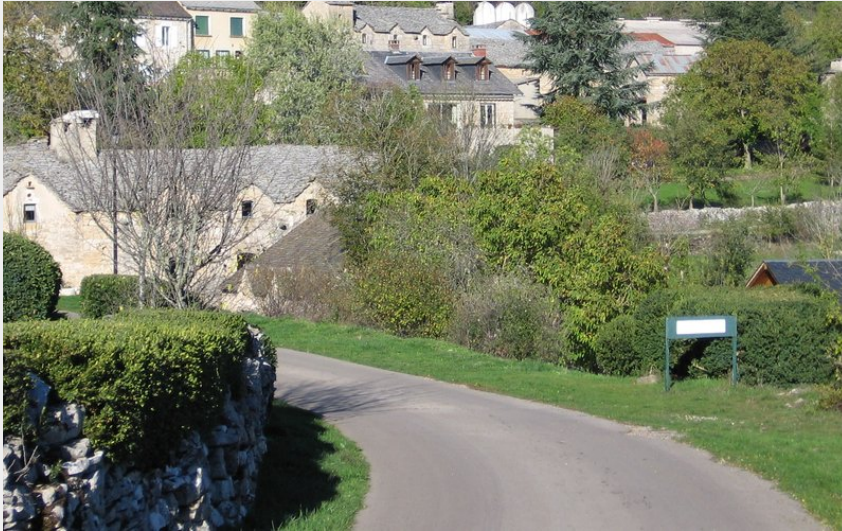
Crédit photo : La Planquette, Gîtes de Combelasais - Le village (La Planquette, Gîtes de Combelasais)