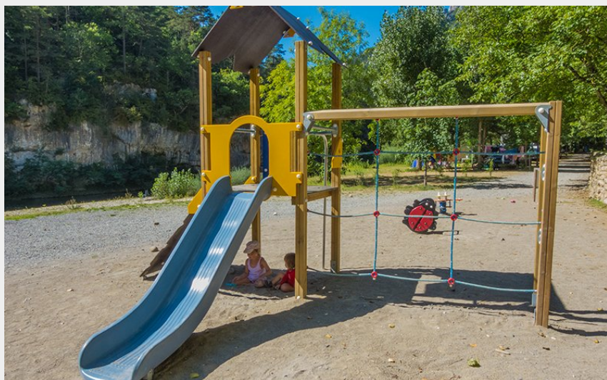
Crédit photo : aire-de-jeux-camping-la-blaquiere-gorges-du-tarn (Camping La Blaqui re)