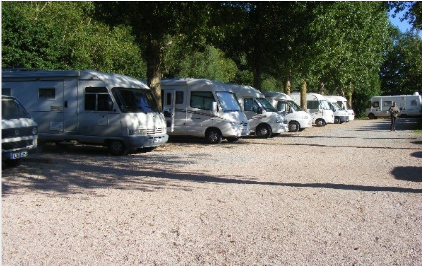
Crédit photo : AIRE MUNICIPALE DE CAMPING-CAR (OFFICE DE TOURISME DU ROUGIER DE CAMARES)