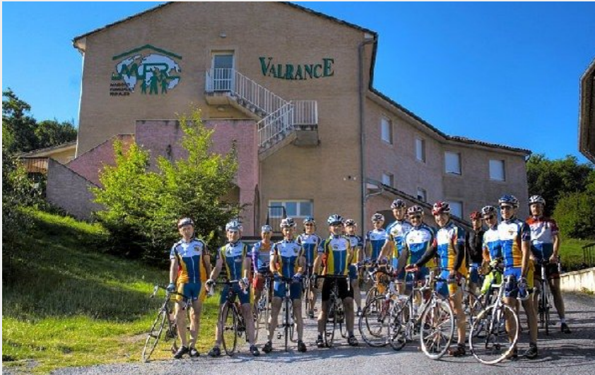
Crédit photo : Groupe d'adultes (Centre de séjours Relais Valrance)