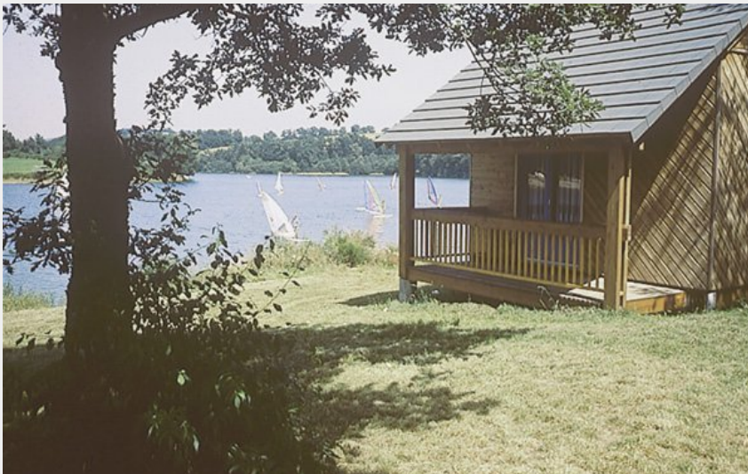
Crédit photo : L'anse du Lac - Village vacances F.O.L. (OFFICE DE TOURISME DE PARELOUP LEVEZOU)