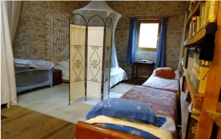
Chambres de la Scierie : chambre familiale