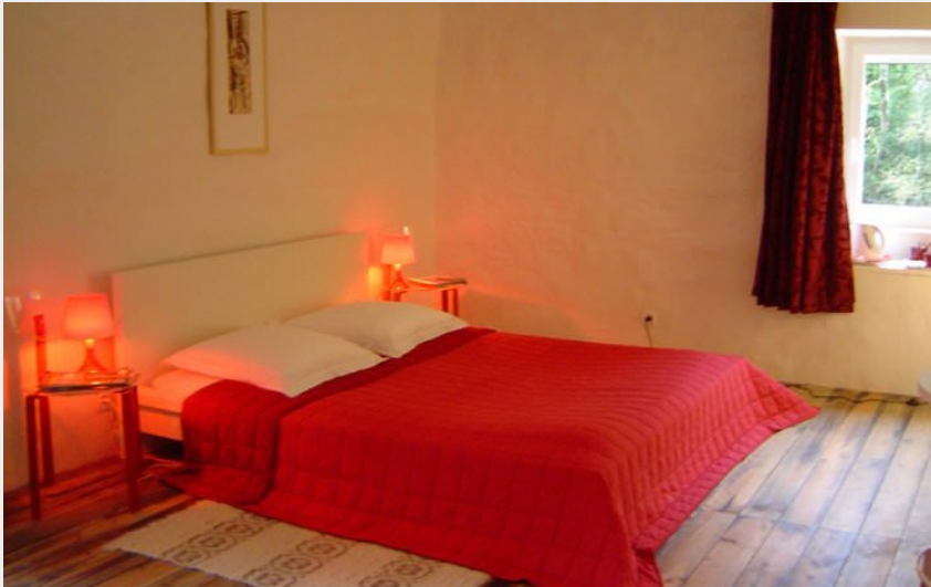
Le Moulin de Gauty