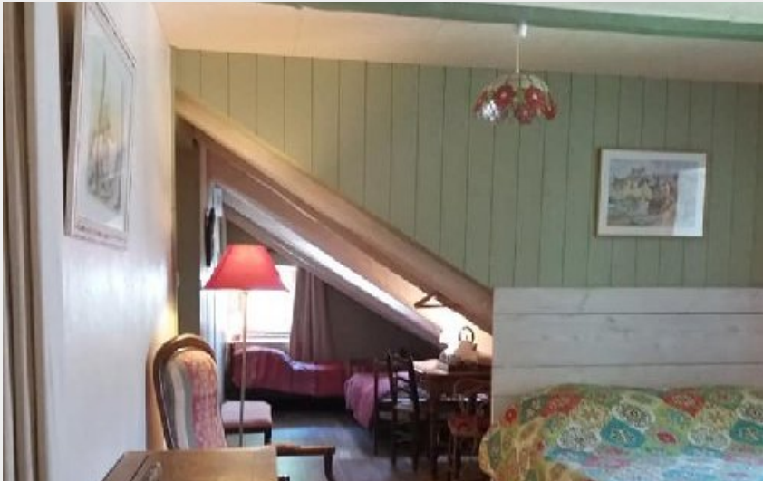
Crédit photo : Chambre familiale Méléze (Domaine d'Angel Berg-Gîte d'étape)