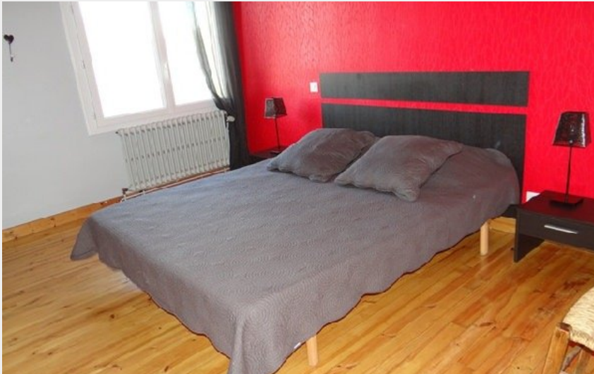
Chambre avec lit en 160