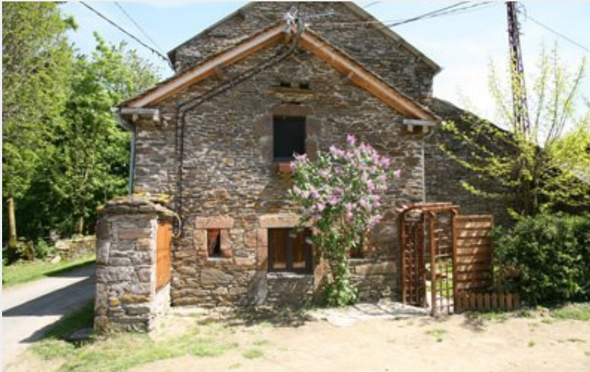
Crédit photo : Mas Capel - H12G005713 (Comité Départemental du Tourisme de l'Aveyron)