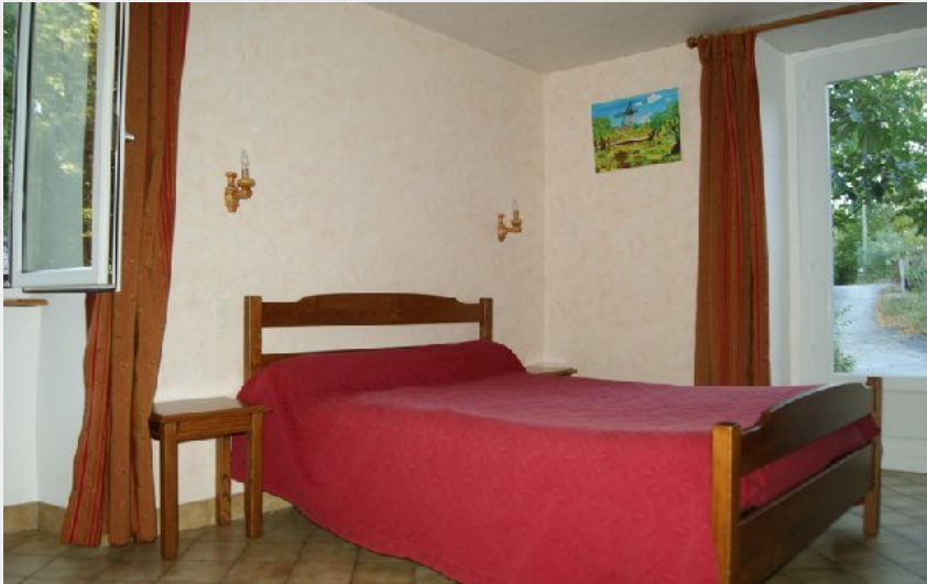
Crédit photo : Chambres d'hotels La Grine (OFFICE DE TOURISME DU ROUGIER DE CAMARES)