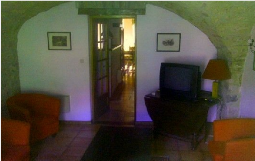
La Chapelle