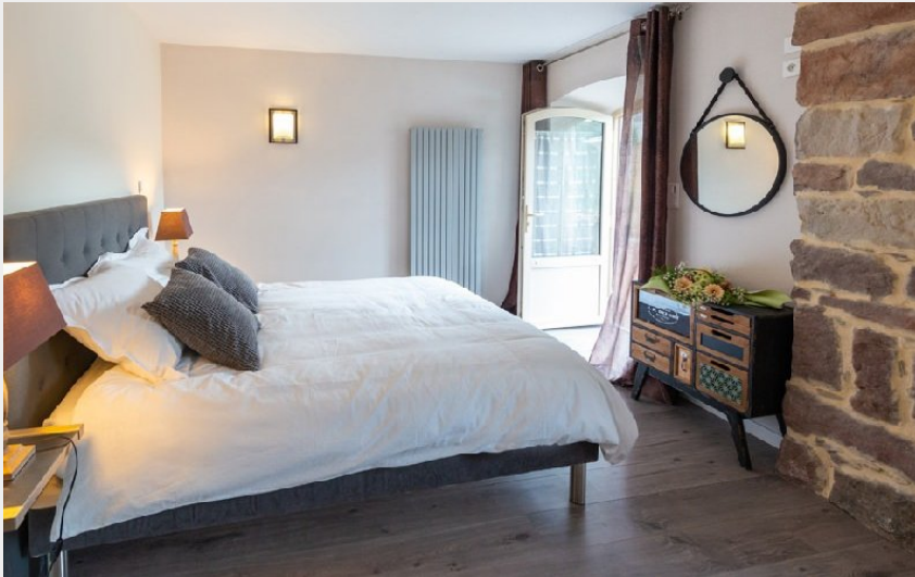
Crédit photo : Chambre familiale "arbre de vie" (Le Clos des Oeillades)