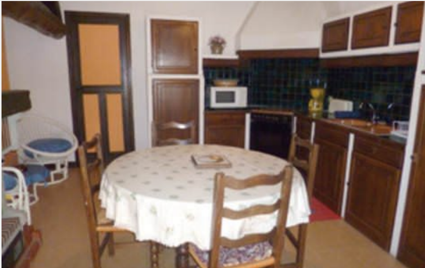
Gîte rural