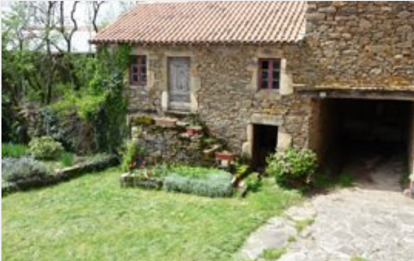
Gîte rural - AYG8025