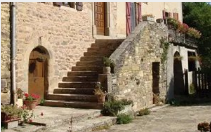
Crédit photo : Gîte rural - AYG8025 (Comité Départemental du Tourisme de l'Aveyron)