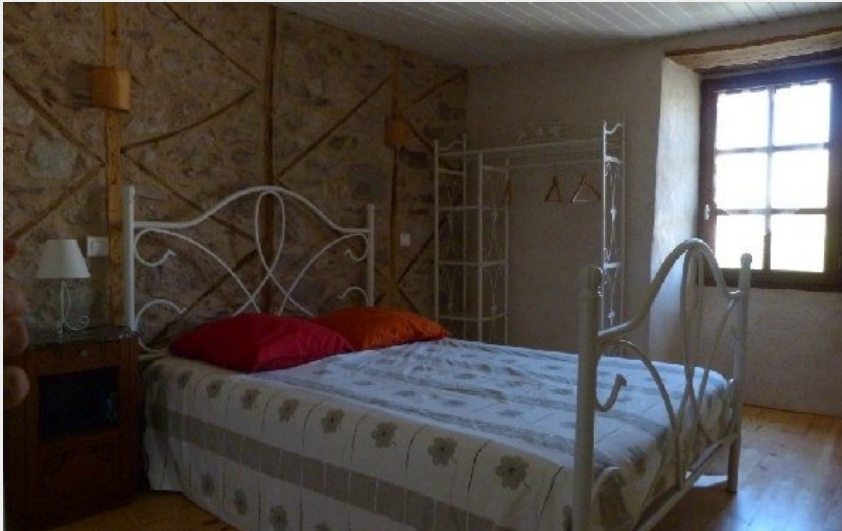
Gîte des Puech - Chambre