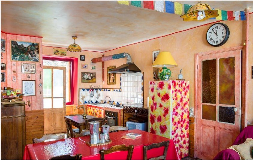
Crédit photo : Niveau 2 : la salle commune colorée et animée (Gîte La Jeanne)