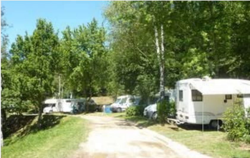
Aire de camping-car