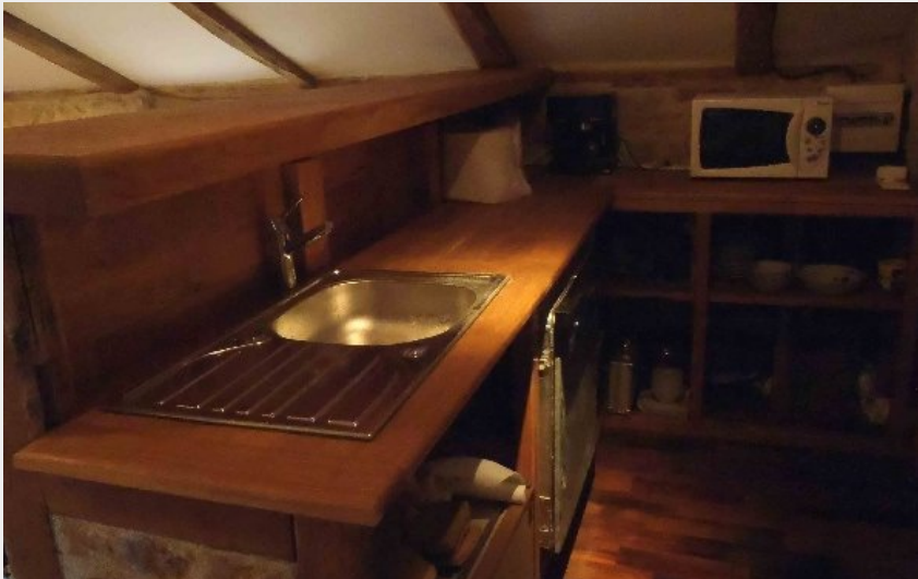
Crédit photo : La Grange de Courry (OFFICE DE TOURISME DE SEVERAC LE CHATEAU)