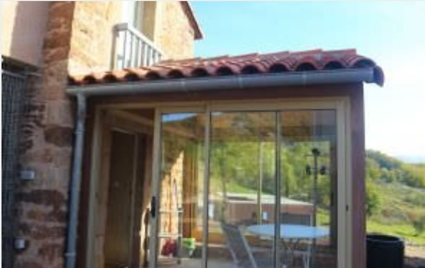
Hameau de Bouyssi