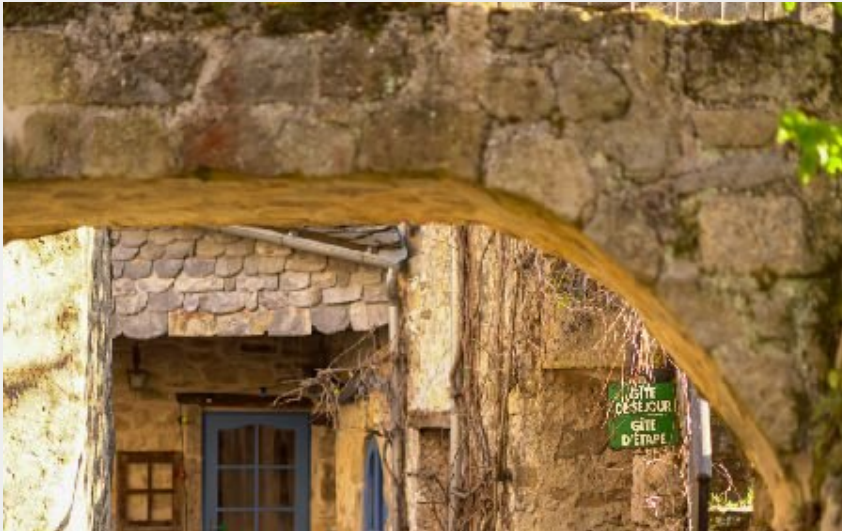
Crédit photo : Gîtes de la Fabarède, vue de la route menant au parking (AUBERGE LA FABAREDE)