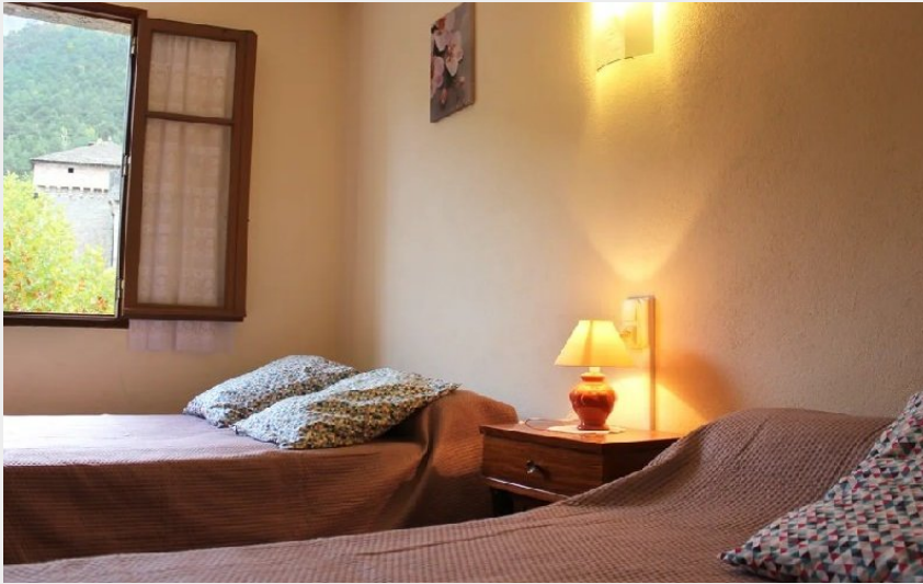
Crédit photo : Les Gîtes d'Yvette - Le Montaigu (Les Gîtes d'Yvette - Bungalow)