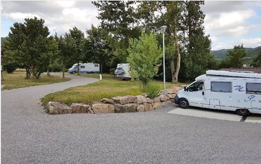
Crédit photo : Aire de camping-cars de Sainte-Eulalie de Cernon (Thierry CADENET)