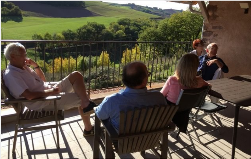
la terrasse couverte Gîte le Sureau du Brugas