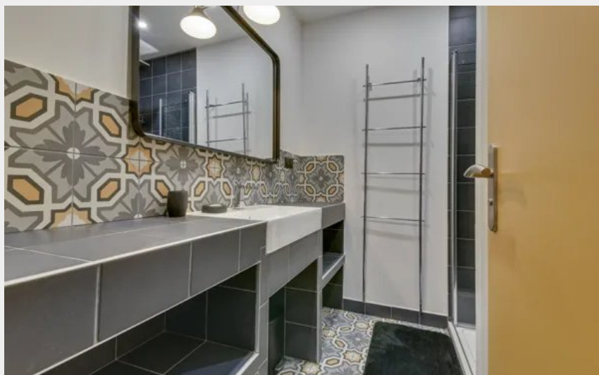
Crédit photo : Château de Linars - L'aile du château (Château de Linars - L'aile du château)