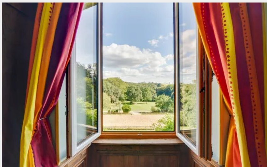
Crédit photo : Château de Linars - 1er étage (Château de Linars - L'aile du château)