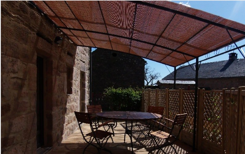
Crédit photo : Gîte de Rouviac - Détente en terrasse (Florent MOSER-BRÉTIGNY)