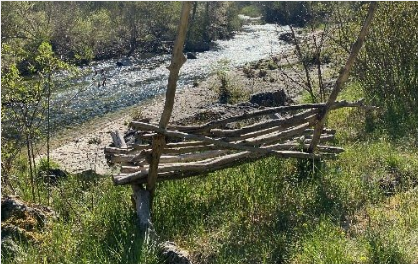
Crédit photo : La jardin et la rivière (Les Chambres de la Dourbie)