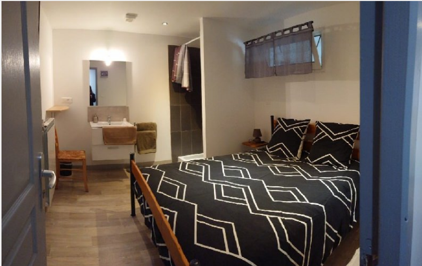
Les Trémières - Aire des marcheurs