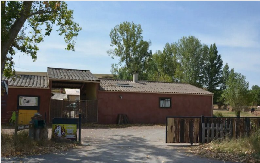
Crédit photo : Gîte à la ferme (Office de Tourisme Rougier d'Aveyron Sud)