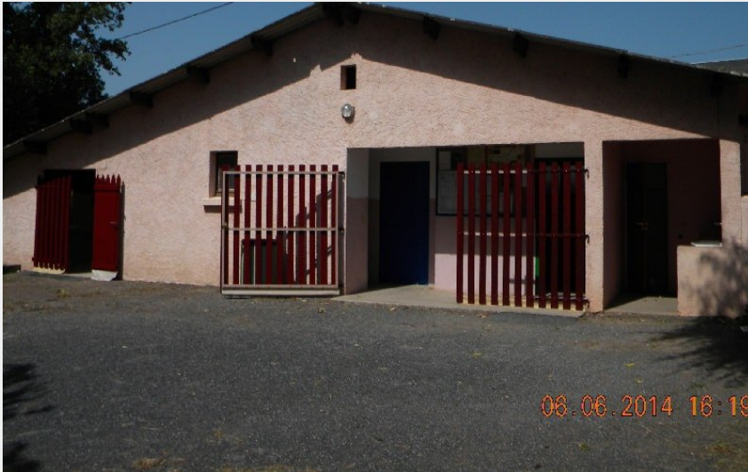
Crédit photo : Aire de camping-cars municipale (Salle du Pressoir au Château de Saint-Izaire)