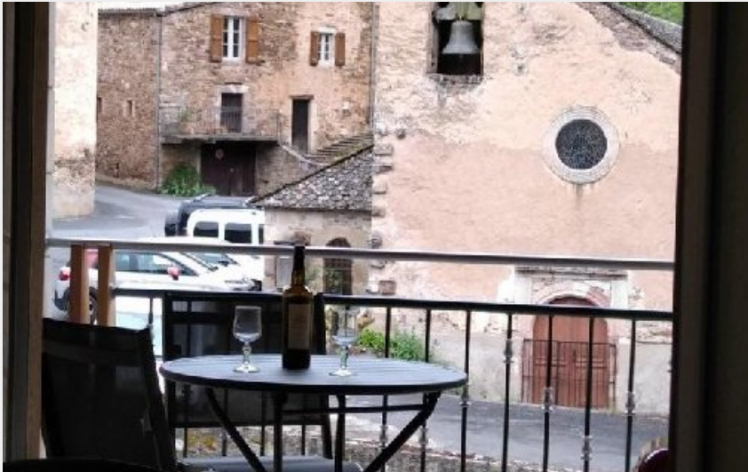
Crédit photo : Gîte d'Orzals (OFFICE TOURISME DU PAYS DE LA MUSE ET RASES DU TARN)