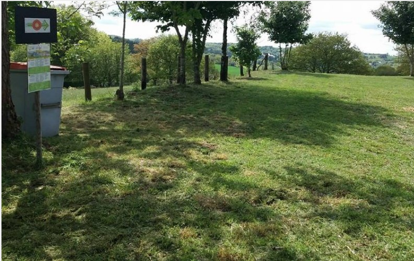
Crédit photo : Aire de camping-car au Mas d'Herens (OFFICE DE TOURISME DE PARELOUP LEVEZOU)