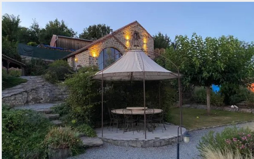
Crédit photo : Gîte Antarès + gloriette (La Maison des Etoiles Aveyron)