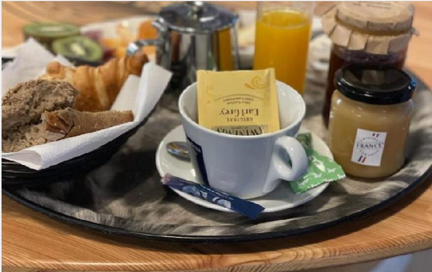
Crédit photo : Les Chambres du MAJESTIC (OFFICE DE TOURISME PAYS DU ROQUEFORT )