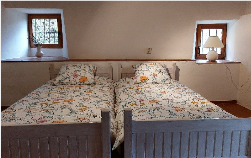
Crédit photo : Gîte La cabane (OFFICE DE TOURISME DU PAYS DE ROQUEFORT ET DU ST-AFFRICAIN)