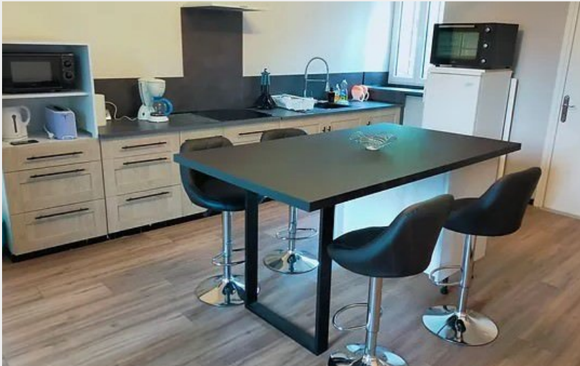
Crédit photo : Cuisine Gite La Chaussée d'Orient ( Gite La Chaussée d'Orient)