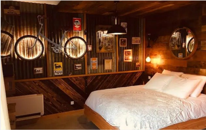
Crédit photo : Le gîte atypique (OFFICE DE TOURISME LARZAC VALLEES)