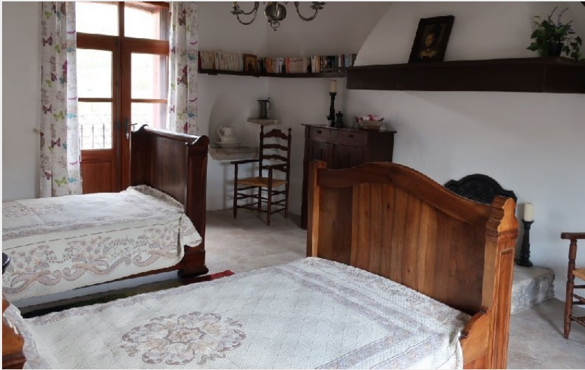
Crédit photo : Maison dans le rempart (OFFICE DE TOURISME LARZAC VALLEES)