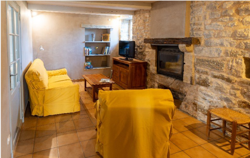
Crédit photo : Gîte Le Fourniol - H12G022421 (Office de Tourisme des Causses à l'Aubrac)