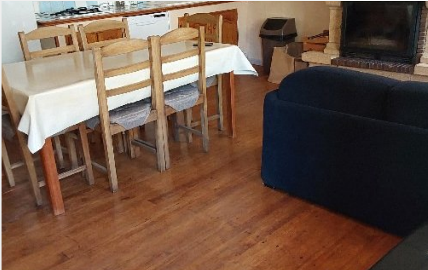
Pièce de vie