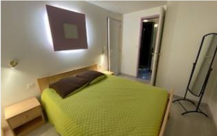
Crédit photo : Gîtes de la Petite Boynarde 1 (Camping Les Peupliers)