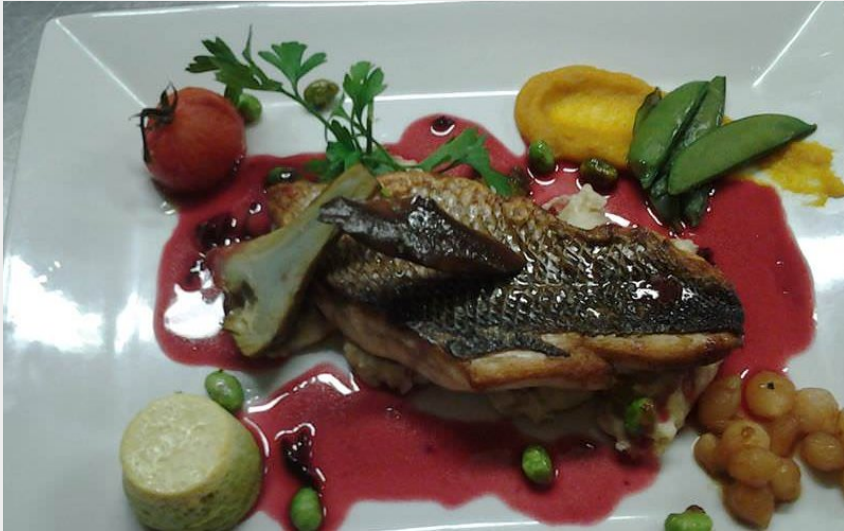
Crédit photo : Assiette du restaurant Entre Terre et Mer (Entre Terre et Mer)