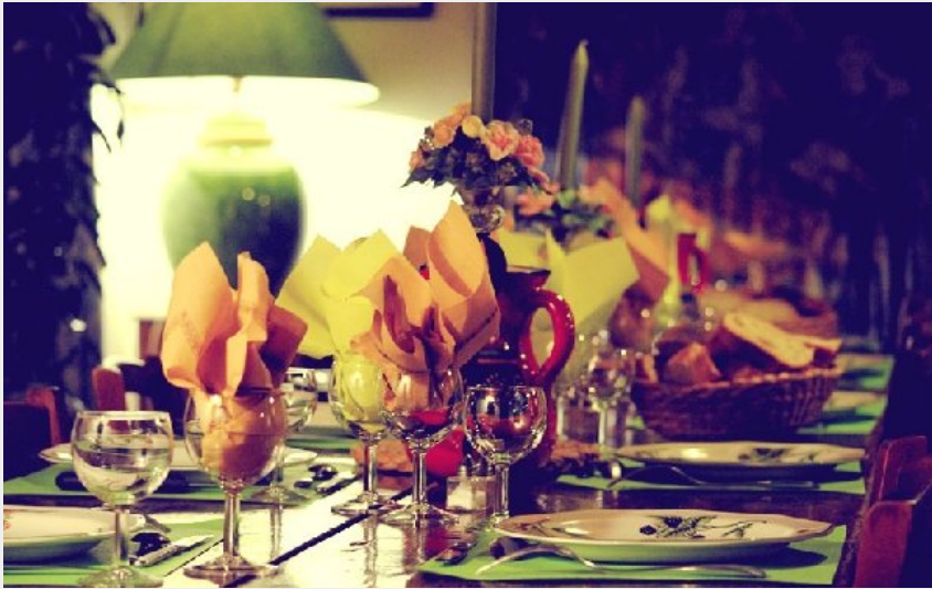
Crédit photo : Table Ferme Auberge de Quiers (Ferme Auberge de Quiers)